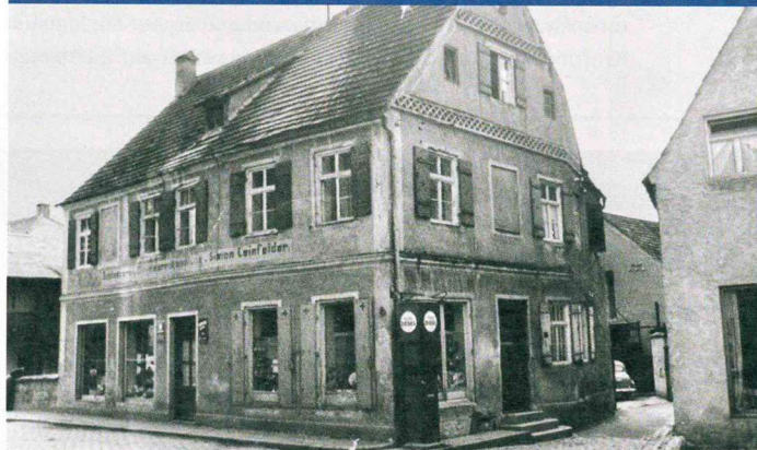
Straßentankstelle „ESSO“ 1924 – 52, Geschäftshaus der Schlosserei bis 1956

Als Dankeschön für unsere Kunden möchten wir ein großes Fest veranstalten. Seien Sie dabei und feiern Sie mit uns. Viele Überraschungen erwarten Sie!